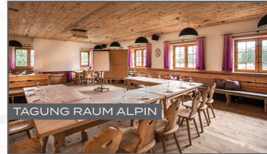
TAGUNG RAUM ALPIN

Sie möchten nicht schon wieder eine Tagung in den immer gleichen Räumlichkeiten der Tagungshotels dieser Welt erleben? Wir verlegen Ihr Meeting in unsere Hütte, wo Sie in inspirierender Atmosphäre tagen können. Wir können Ihnen unterschiedliche Räumlichkeiten mit verschiedenen Kapazitäten anbieten. Oder Sie tagen gleich unter freiem Himmel auf unserer großzügigen Sonnenterrasse? Beim Anblick der Oberjocher Bergwelt können Sie nur auf himmlische Ideen kommen! Selbstverständlich kümmern wir uns auch um Bestuhlung, Tagungs-Verpflegung und Technik.